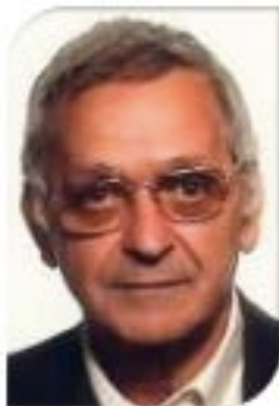
Pr Moise Namer