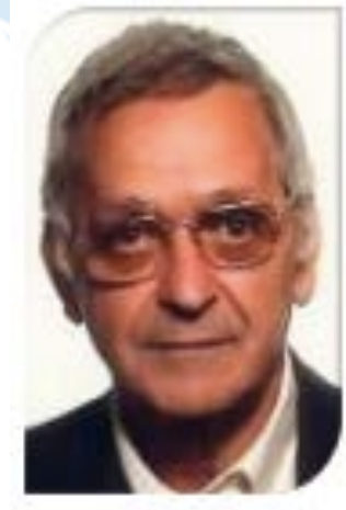
Pr Moïse Namer CAL Nice F